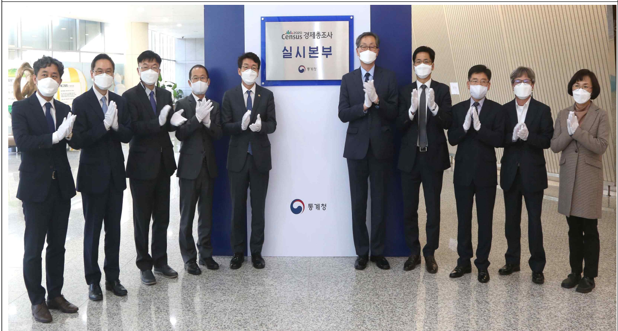
2020년 기준 경제총조사 실시본부 현판 제막식