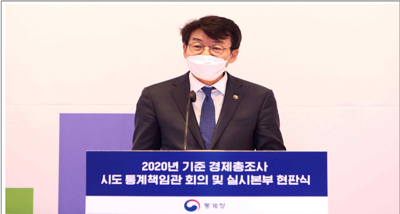
2020년 기준 경제총조사 시도 통계책임관회의에서 인사말을 하는 류근관 통계청장