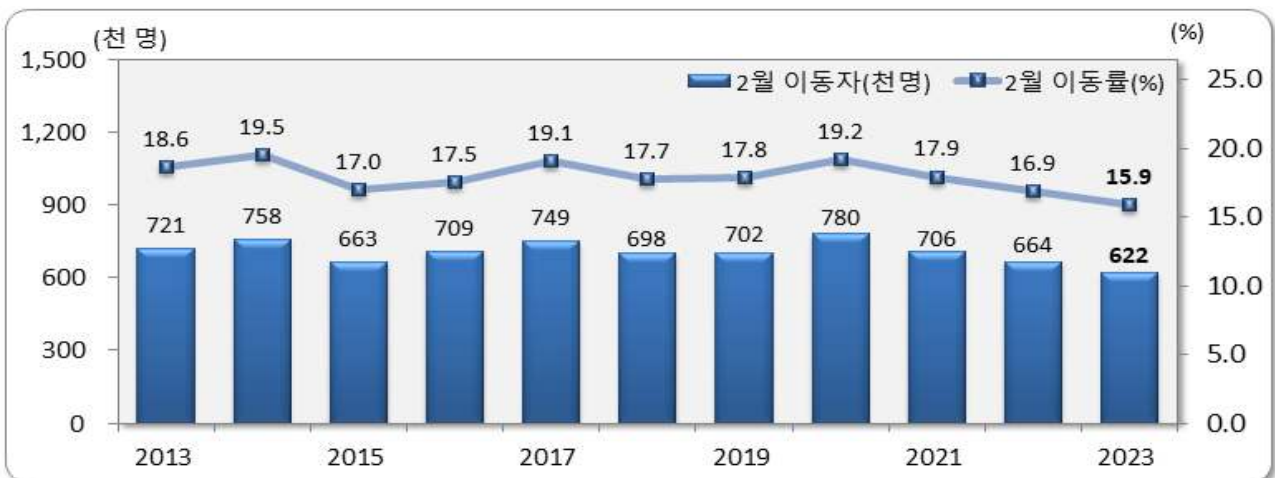
[그림 1] 전국 2월 인구이동