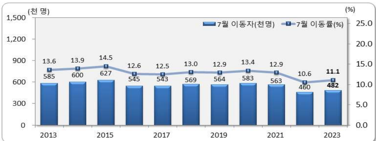
[그림 1] 전국 7월 인구이동