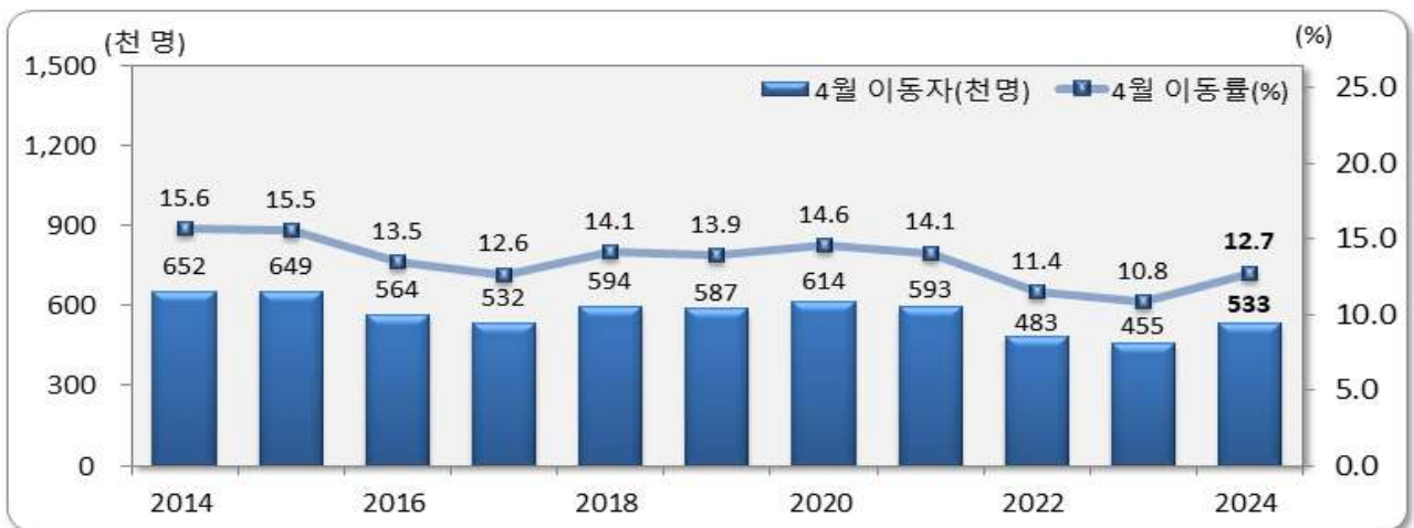
[그림 1] 전국 4월 인구이동