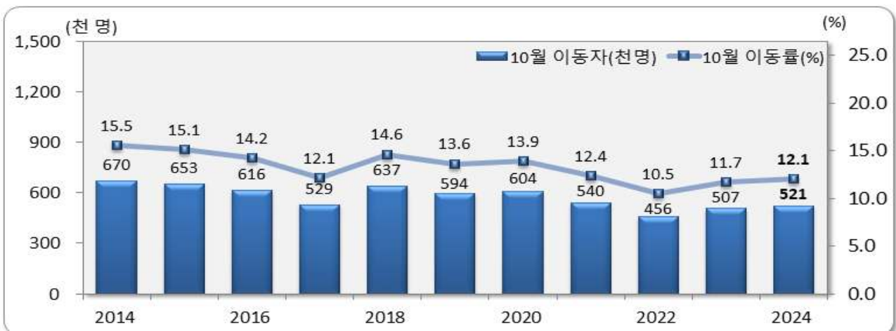
[그림 1] 전국 10월 인구이동