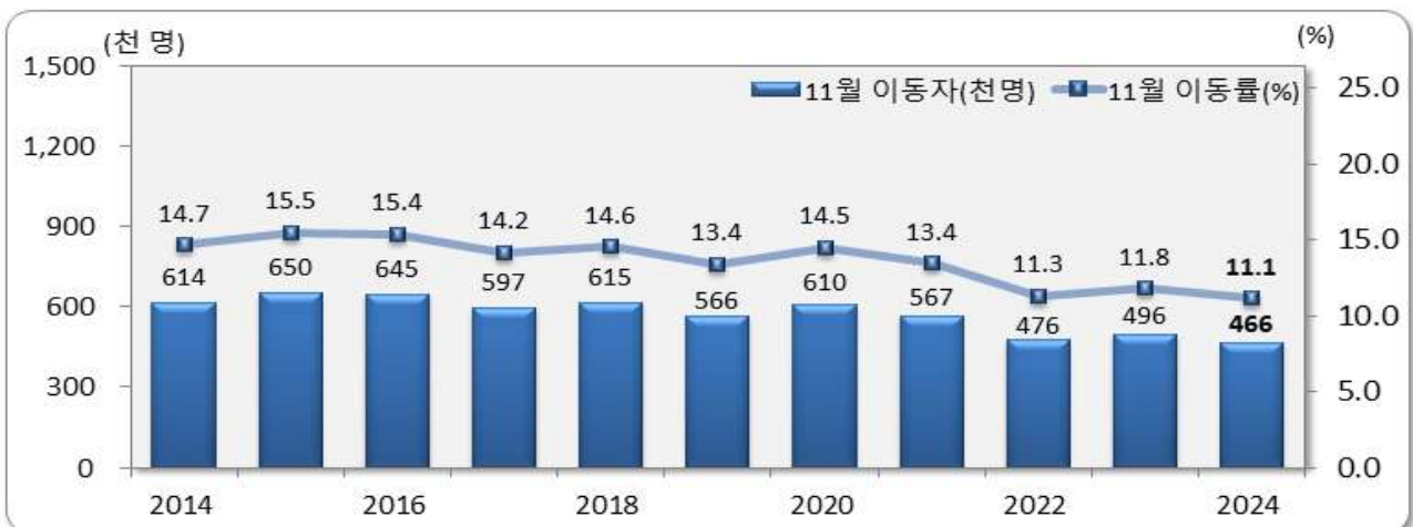
[그림 1] 전국 11월 인구이동