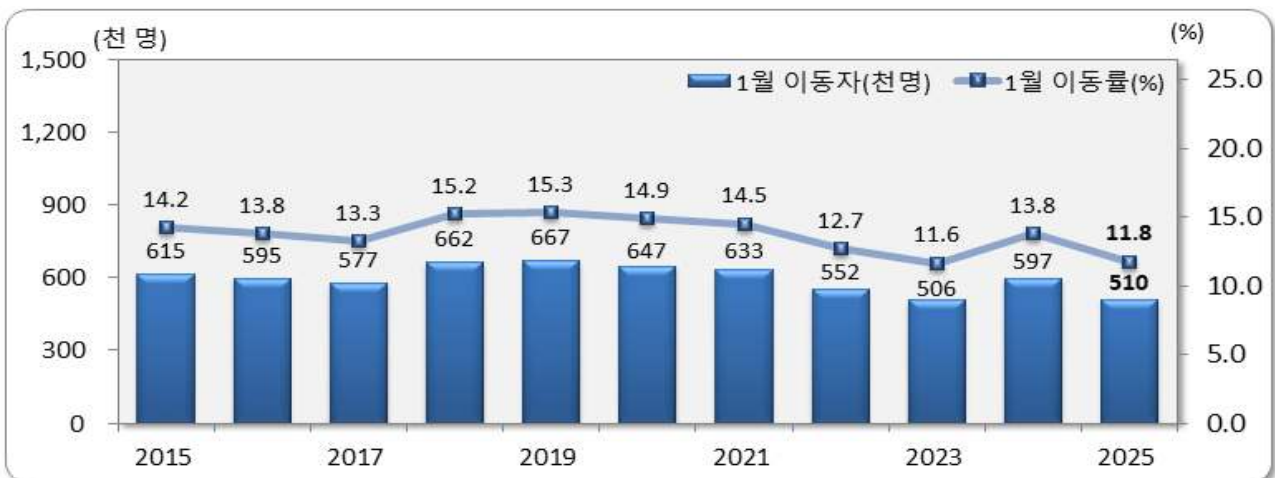
[그림 1] 전국 1월 인구이동