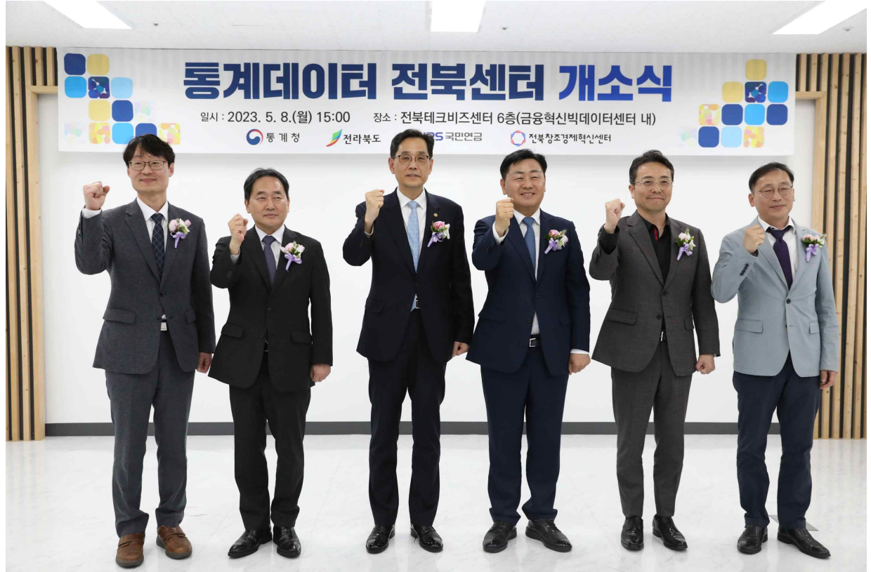
통계데이터 전북센터 개소식 기념촬영 (한훈 통계청장 왼쪽에서 세 번째)