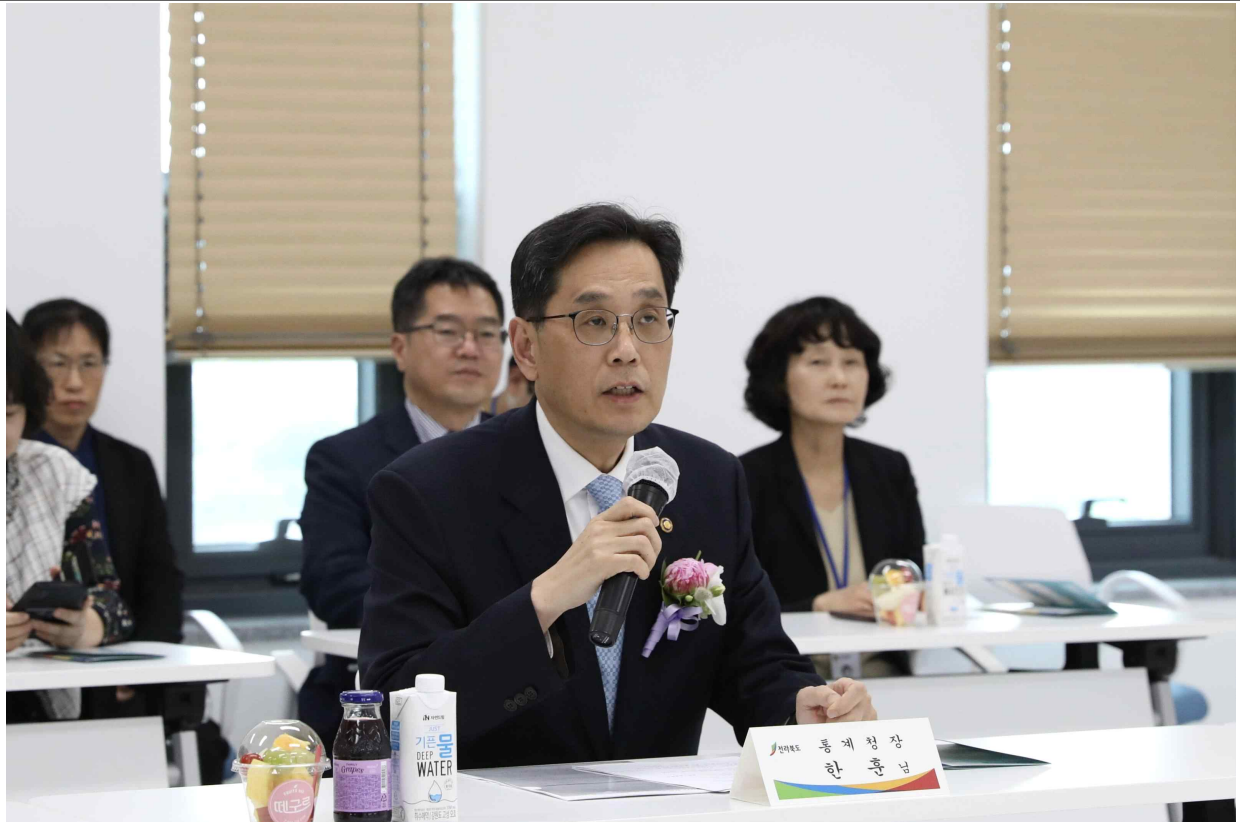
통계데이터 전북센터 개소식에서 인사말씀을 하는 한훈 통계청장