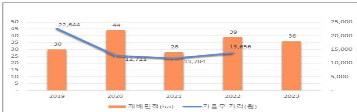
< 가을무 재배면적 및 가격 추이 >

* 가을무 도매가격(KAMIS 농산물 유통정보, 상품 20kg, 도매, 전국 연평균) · ('19) 22,644원 → ('20) 12,721원 → ('21) 11,704원 → ('22) 13,656원 → ('23) 미제공